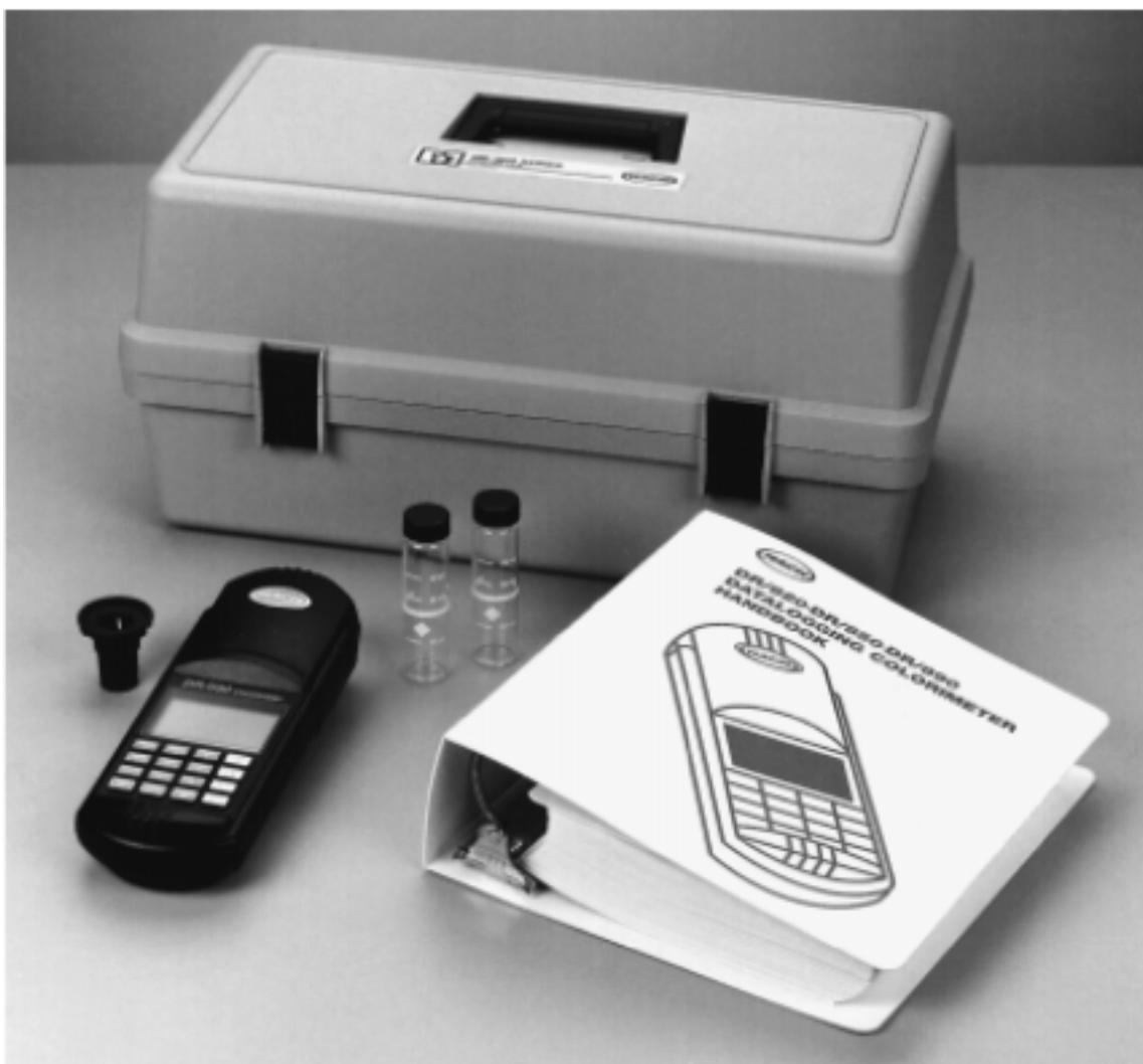
图 1 DR/800 系列色度仪标准包装*